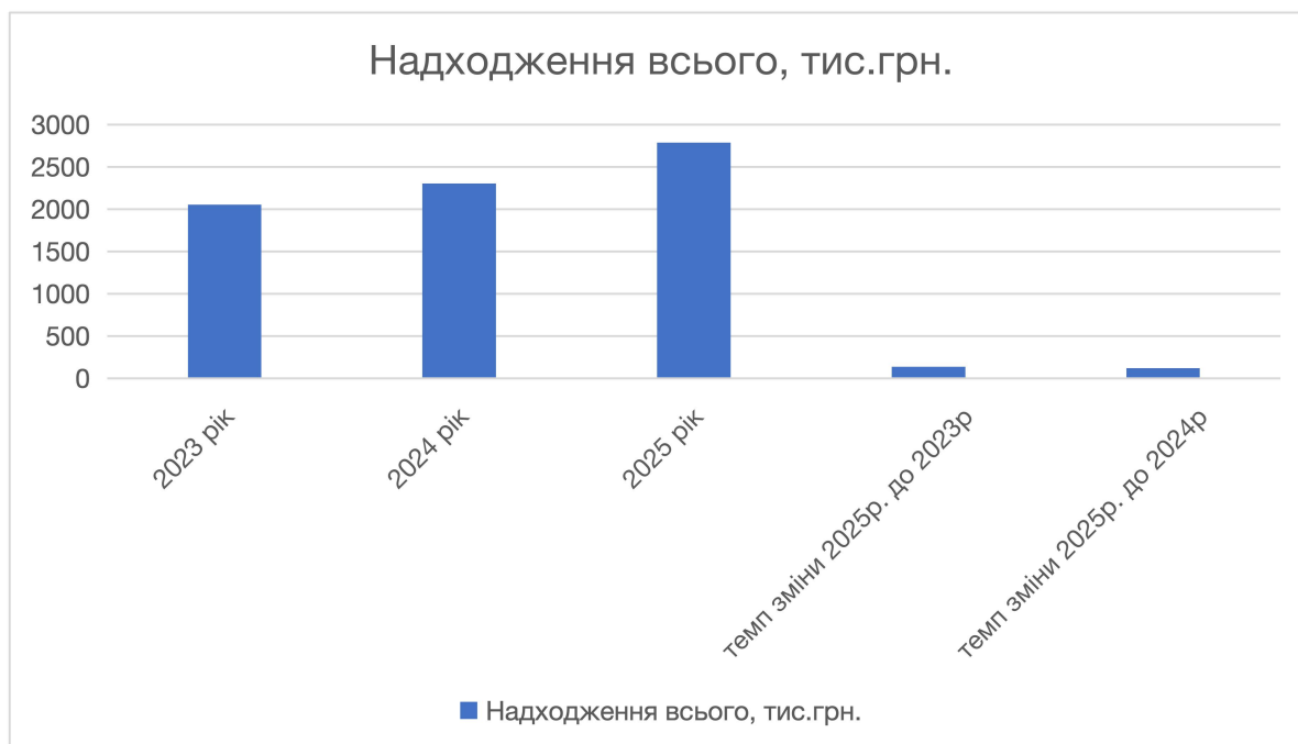
Рис 2.2 Доходи Тростянецької громади

При затверджених показниках надходжень бюджет Тростянецької міської територіальної громади затверджено в загальній сумі 360 196,0 тис. гривень, із них загальний фонд – 353 303,5 тис. гривень та спеціальний фонд – 6 892,5 тис. гривень [6]. До бюджету Тростянецької міської територіальної громади за січень-вересень 2025 року зараховано в сумі 295 543,8 тис. гривень, з них: доходи загального фонду – 260 140,9 тис. гривень та спеціального фонду – 35 402,9 тис. гривень.