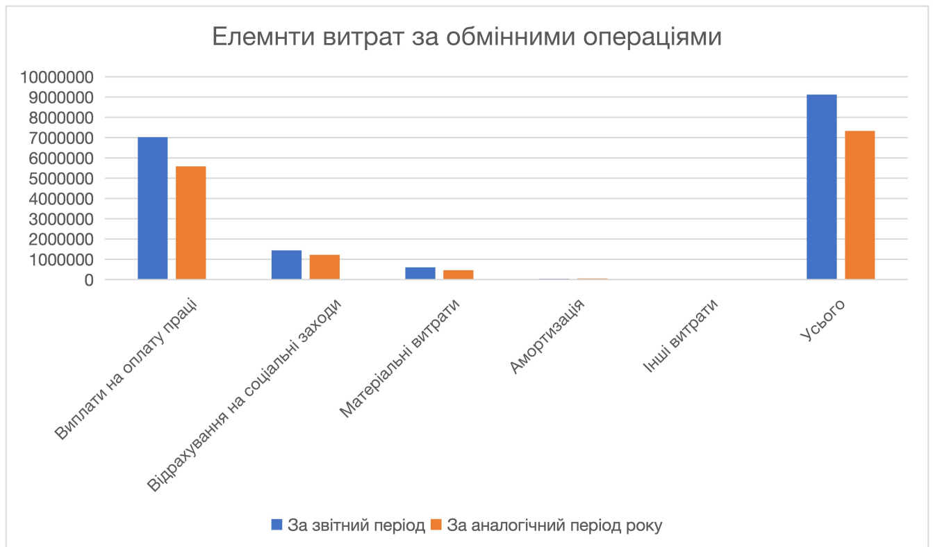
Рис. 2.3 Елементи витрат за обмінними операціями Охтирської громади за 2024, 2025 роки.

Видатки затверджено в сумі 710 943,0 тис. грн, фактичне виконання — 696 619,4 тис. грн (98,0%). Найбільша частка спрямована на освіту (52,0%), охорону здоров'я (7,2%) та соціальний захист (5,8%), що підтверджує соціальну спрямованість бюджету. Оплата праці становить 57,5% усіх видатків.